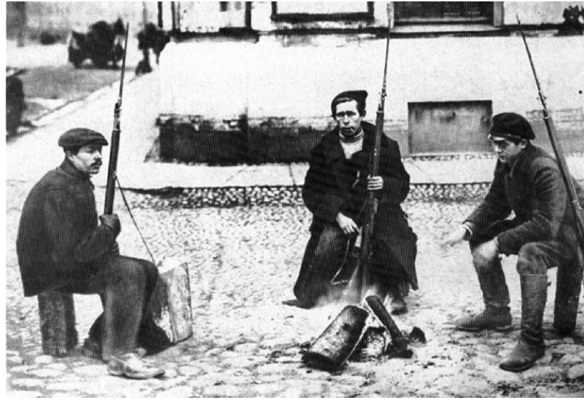
एक कारखाने के गश्ती मज़दूर, 1917 अक्टूबर

क्या एक ऐसा भी समाज हो सकता है जिसमें कोई अमीर न हो और कोई गरीब न हो? कोई मालिक, कोई ज़मींदार न हो? क्या कोई ऐसा देश हो सकता है जो कहे कि हम किसी के साथ युद्ध नहीं करेंगे या किसी भी प्रान्त पर हुकम नहीं चलाएँगे? क्या ऐसा हो सकता है कि भूखे व गरीब कभी हिम्मत करके पूरे देश का शासन अपने हाथों में ले लें। क्या ऐसा भी कोई देश व सरकार हो सकती है जिसमें मेहनत करने वाले मज़दूर व किसानों के हितों का ध्यान सबसे पहले रखा जाए?