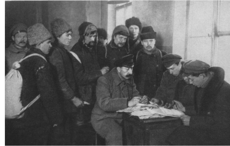
क्रान्ति की रक्षा के लिए बनी लाल फौज में भर्ती होने आए मज़दूर

इसके तुरन्त बाद क्रान्तिकारी सरकार ने तीन महत्पूर्ण