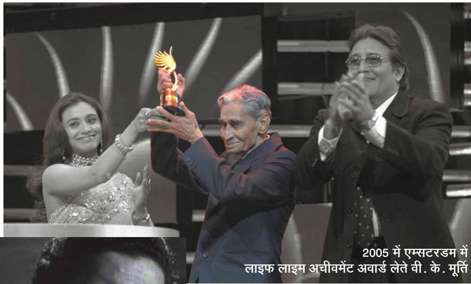
2005 में एम्सटरडम में लाइफ लाइम अचीवमेंट अवार्ड लेते वी. के. मूर्ति

इसी कमाल के लिए बीती 21 जनवरी को वी. के. मूर्ति को दादा साहिब फालके पुरस्कार से नवाज़ने की घोषणा हुई है। वे पहले सिनेमैटोग्राफर हैं जिन्हें यह पुरस्कार मिल रहा है। वी. के. मूर्ति से गुरुदत्त, लाइट, कैमरा, संगीत, टेक्नॉलॉजी पर हुई बातचीत के सम्पादित अंश: