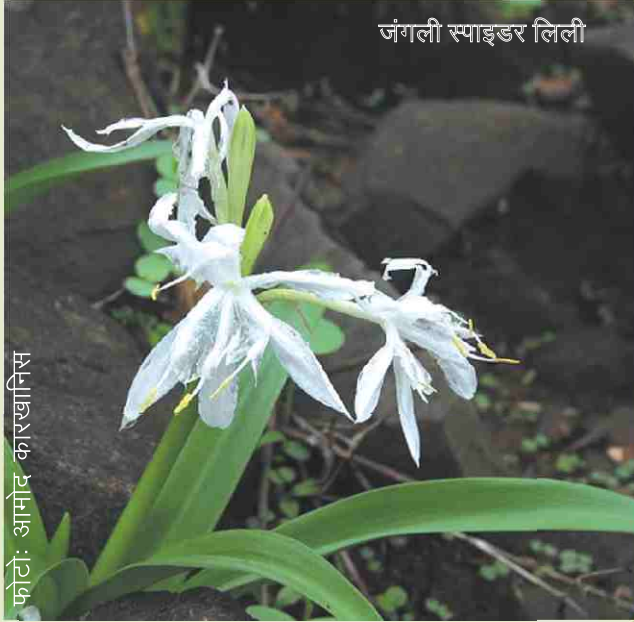
जंगली स्पाइडर लिली