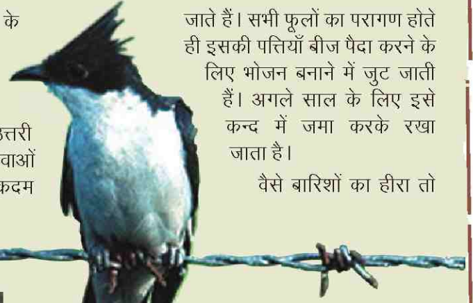
पाइड क्रेस्टड कुकु