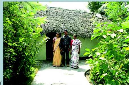
17 दिसम्बर, हिन्दुस्तान टाइम्स

मैं उनसे कहूँगा कि वे छोटे पैमाने से शुरू करें और बाद में उसे फैलाएँ।