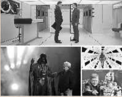
मायथॉलॉजी, विज्ञान और समाज