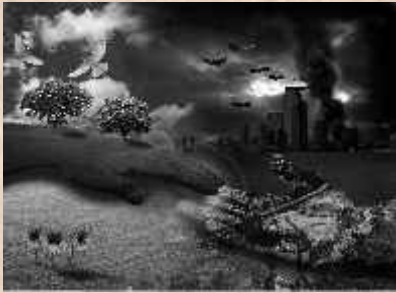
पर्यावरण एवं सामाजिक खुदकुशी की ओर सौ दिन