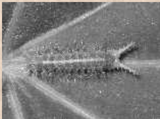
क्या शाकाहारी कीट वर्गीकरण करते हैं?