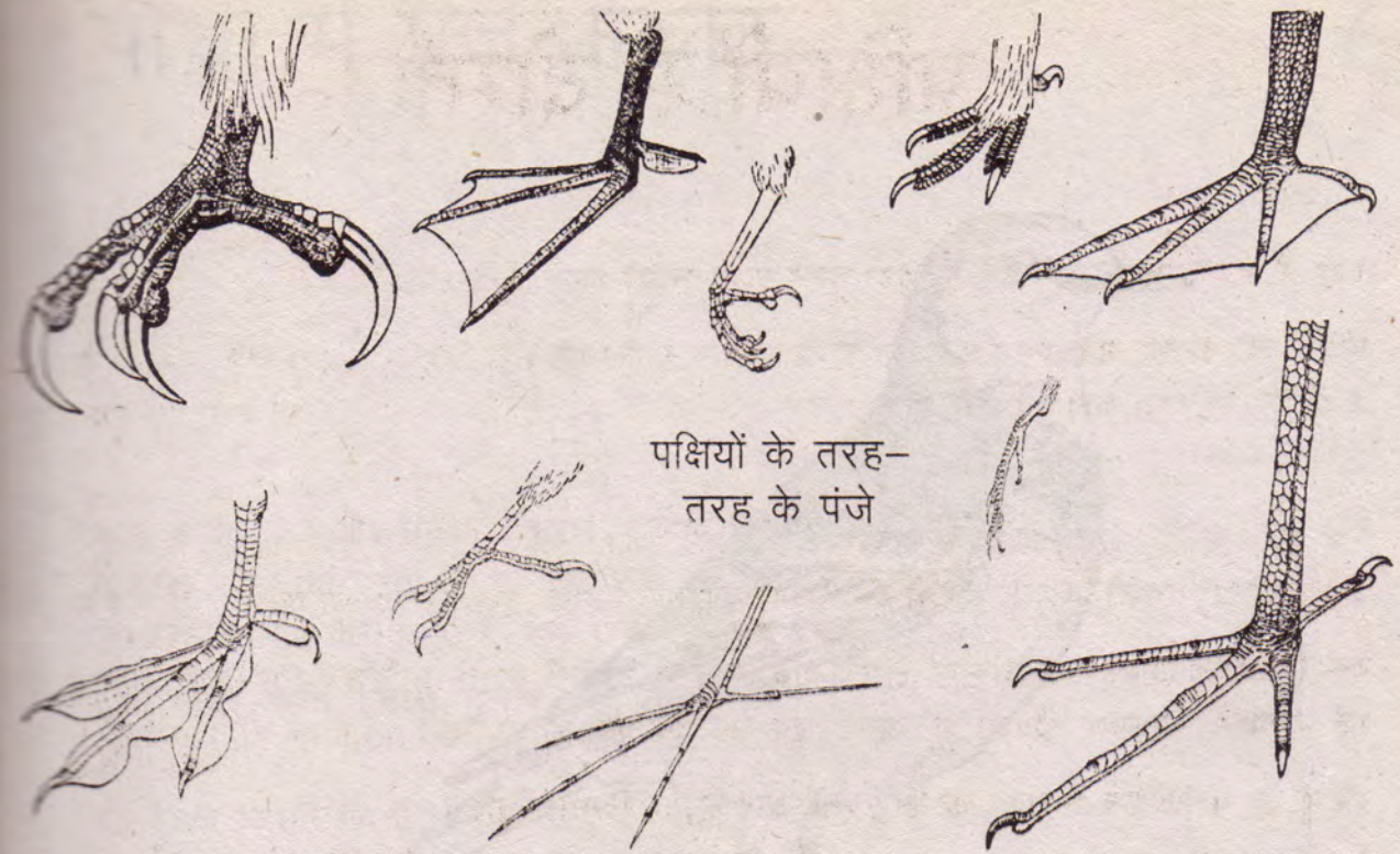
पक्षियों के तरह- तरह के पंजे

पैर: पैर लंबे हैं या छोटे? नाखून कैसे हैं? पक्षी कैसे बैठता या चलता है?