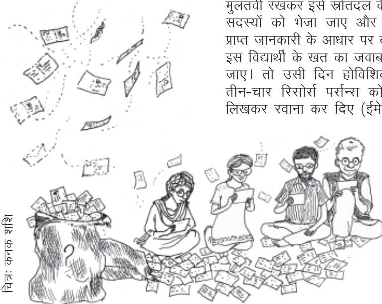
चित्र: कनक शशि

समस्त कुण्डलियाँ एक ही तरफ घूमती हैं? या एक ही बेल पर दोनों तरह से घूमते हुए तन्तु पाए जाते हैं? या क्या एक प्रजाति की सब बेलों की कुण्डलियाँ एक ही तरह की होती हैं? यानी कि क्या करेले की एक लता की समस्त कुण्डलियाँ एक ही तरफ होंगी या फिर करेले की सब लताओं की कुण्डलियाँ? ऐसे बहुत-से सवाल उठ खड़े हुए। उस समय जो छह-सात लोग मौजूद थे उनमें से कोई भी जीवविज्ञान का विद्यार्थी नहीं रहा था, न ही हम में से कोई जंगल-ज़मीन से बहुत करीब से जुड़ा था जिसने इस पहलू पर बारीकी से गौर किया हो। इसलिए तय हुआ कि सबसे अच्छा यही होगा कि इस खत का जवाब मुलतवी रखकर इसे स्रोतदल के कुछ सदस्यों को भेजा जाए और उनसे प्राप्त जानकारी के आधार पर बाद में इस विद्यार्थी के खत का जवाब दिया जाए। तो उसी दिन होविशिका के तीन-चार रिसोर्स पर्सन्स को खत लिखकर रवाना कर दिए (ईमेल को