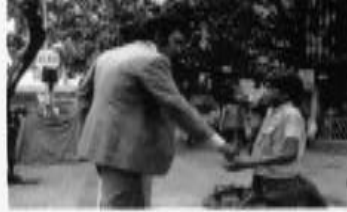
1975 में बनी पीपल फिल्म में जूरी पॉलिश करने वाला एक लड़का प्रेक कर दिए गए पैसे को उतारने से इंकार कर देता है। यह भांगला है कि उसके काम को भी गरिया है और उसे उसका भुगतान अंतर के साथ किया जाया चाहिए।