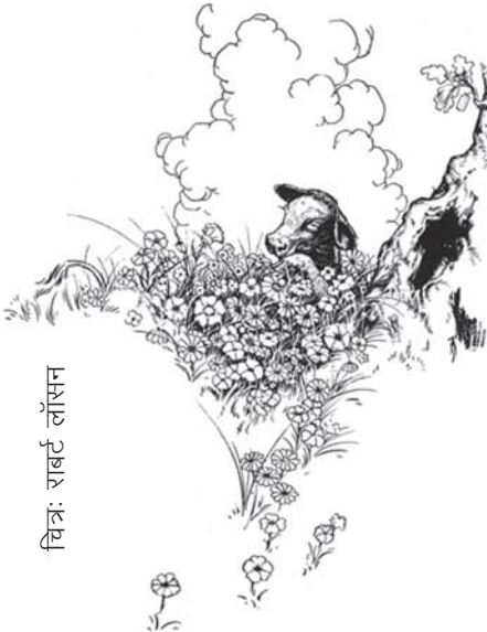
चित्र: राबर्ट लॉसन