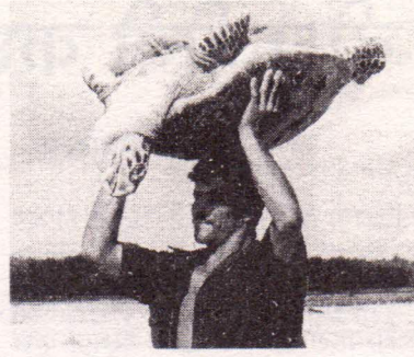
कछुए का ताज पहने यह स्थानीय व्यापारी। इस कछुए की कीमत इसके मांस और सुन्दर चितकबरी पीठ से आंकी जाती है। इसी से कछुए की शलक के असली आभूषण बनते हैं।

शिकार करता है। विश्व में अनेक स्थानों पर कछुओं का मांस खाया जाता है तथा उनके अण्डों को भी स्वादिष्ट माना जाता है। हमारे देश में उड़ीसा तथा प. बंगाल और कुछ अन्य क्षेत्रों में भी ऐसा ही माना जाता है। इसीलिए तटों पर छुपाए गए अण्डों को लोग ढूँढ निकालते हैं।