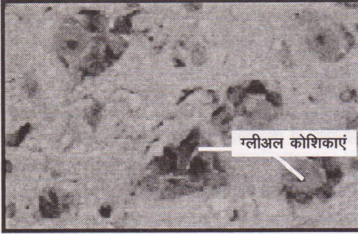
मनुष्य के मस्तिष्क में ग्लीअल कोशिकाएं

सुलभ पक्ष को महत्व नहीं देना चाहिए? तब क्या विज्ञान में कुछ स्त्री सुलभ बचा रहेगा और हम क्या कुछ गंवा देंगे? क्या यही कारण है कि विज्ञान के दायरे में महिलाओं की अपेक्षा पुरुषों की उपस्थिति अधिक सहज मानी जाती है।