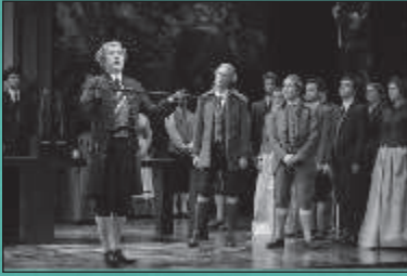
संगीत मस्तिष्क को लाभ पहुंचाता है