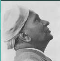
चंद्रशेखर वेंकट रामन और विज्ञान दिवस