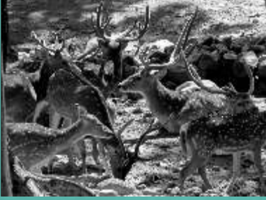
संसार - स्वार्थियों का बाज़ार