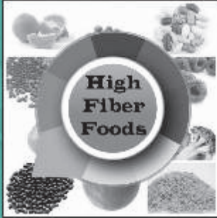
अपाच्य भोजन भी लाभदायक हो सकता है