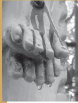
चमत्कार का भांडा फूटा