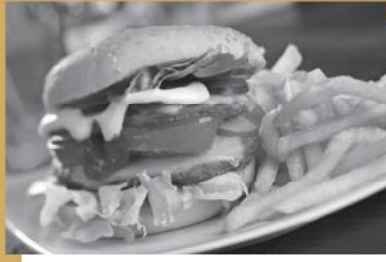
मुख्य बात है कब खाएं, न कि क्या खाएं